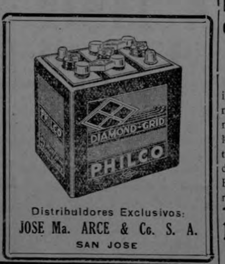
Distribuidores Exclusivos: JOSE Ma. ARCE & Co. S. A. SAN JOSE